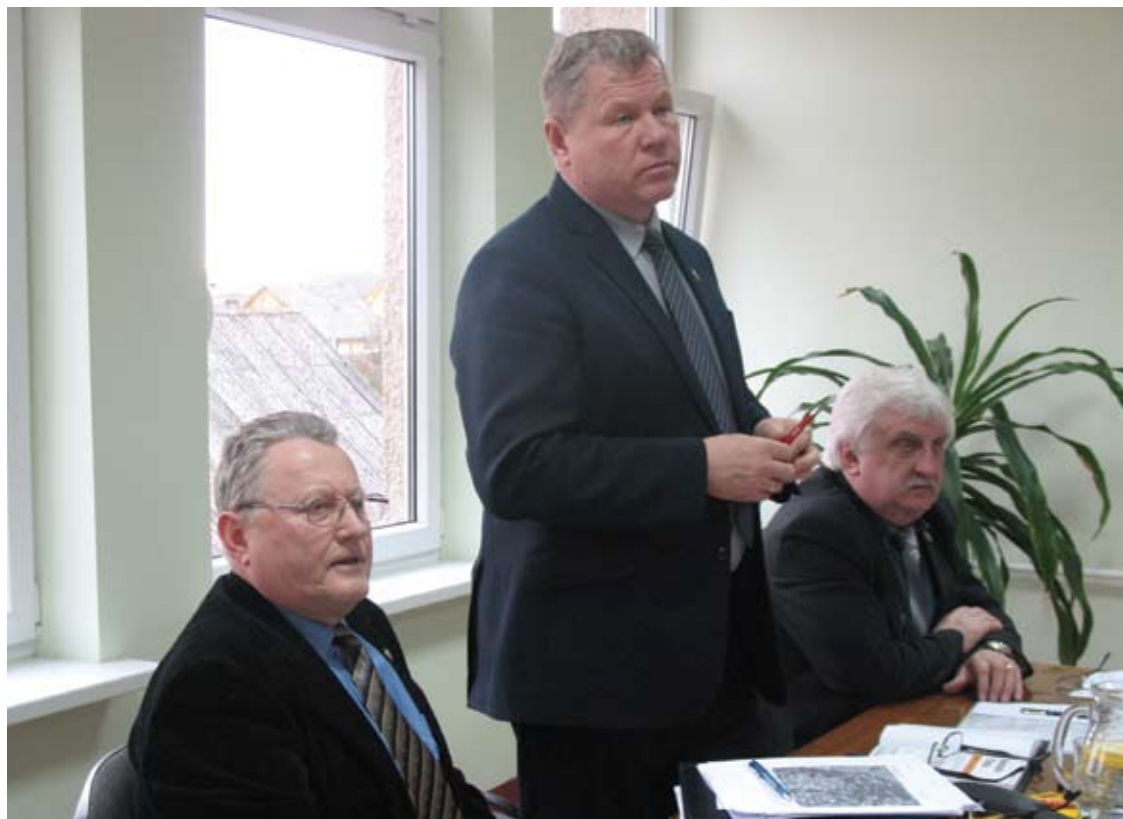
Meras Kęstutis Tubis Kavarske tvirtino, kad jis padarė jau daugiau nei planavo.

Vidmantas ŠMIGELSKAS vidmantas.s@anyksta.lt