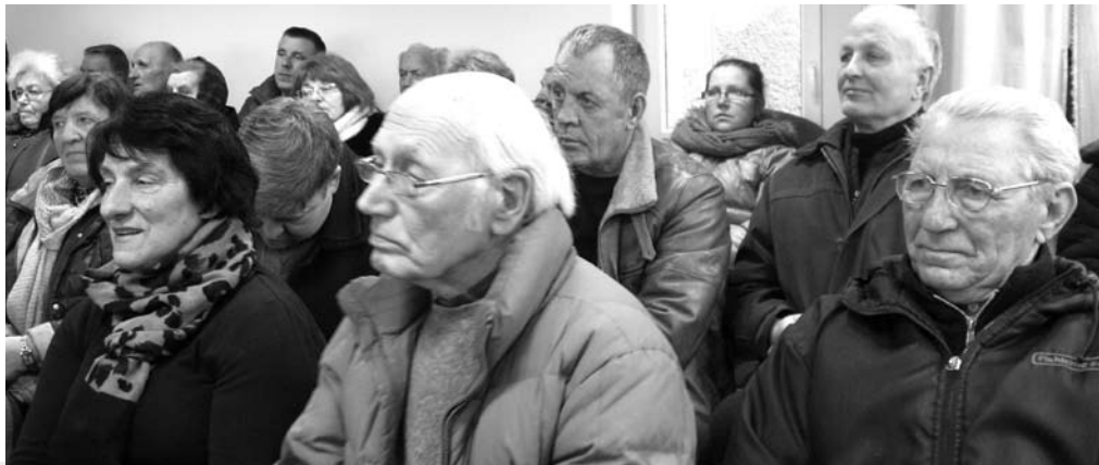
Į susitikimą su rajono meru atėjo būrys kavarskiečių – seniūnijos salė buvo sausakimša.