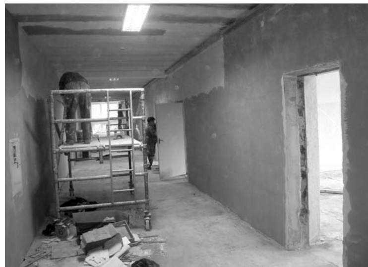
J. Biliūno gimnazijos remontas niekaip nesibaigia dvejus metus.

Kaimynai iš Janonio g., Draugystės g., Vorutos g.